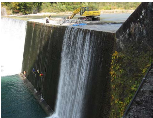
図-3 登攀技術を有する点検員による詳細調査例

上記と同様に施設の内部状況に関しての情報が必要な場合、かつ破壊調査が許されない場合の次善対応策として、弾性波探査や電磁波レーダ等による内部状況の推定を行う。なお、破壊調査が可能な場合、この調査を併用することで、非破壊調査の精度の検証を行うことも可能である。