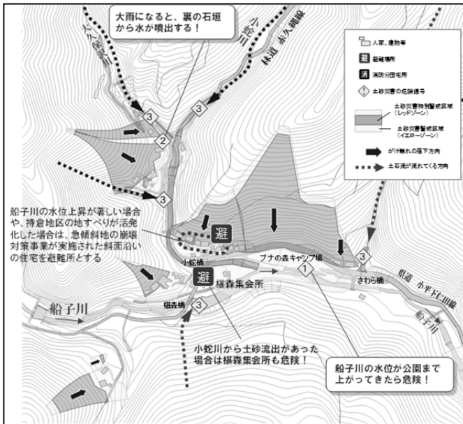
図 3 ハザードマップの作成