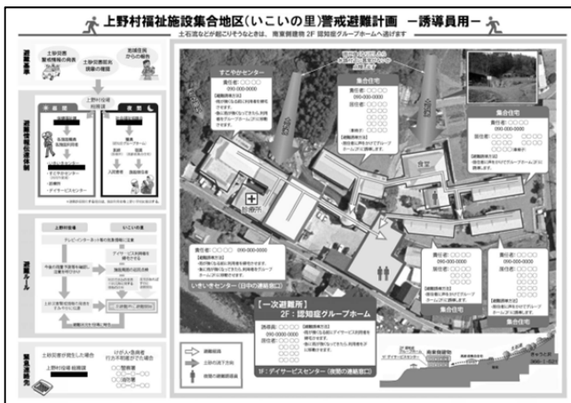
図 4 「いこいの里」警戒避難計画

上野村の災害時要援護者関連施設である「いこいの里」の警戒避難計画の課題として、①施設利用者が通常よりも避難に時間を要する、②避難行動に健常者の支援が必要、③避難所候補地（距離 2km 以上）への施設利用者の徒歩による避難は困難等があり、課題の解決方針として施設内の安全な場所への一時避難が流域協議会で計画されている（図 4）。この警戒避難計画の有効性を確認するため、県・村・施設職員・施設利用者を交えて防災避難訓練を流域協議会が主催となり実施し、警戒避難計画の検証を行っている。