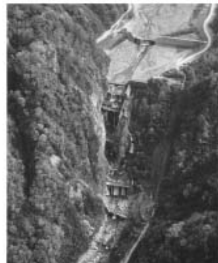
写真1 白岩砂防堰堤全景

昨年9月28日には、富山県が「立山・黒部 ~防災大国のモデル~」をコンセプトとした世界文化遺産登録の提案書を文化庁に提出している。文化庁による世界文化遺産登録の審査基準では、登録範囲内に複数の国指定の文化財等を有する必要があり、白岩砂防堰堤に新たに国重要文化財候補として注目を集めている。