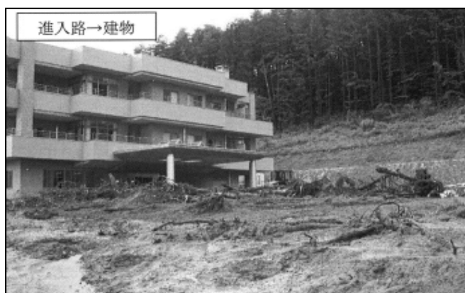
図-1 特別養護老人ホームでの土石流出状況

また、施設への侵入路に土砂が堆積していたこと、入居者の移動に必要な車や受入れ先を確保する準備がなかったことから、施設外への避難は実質不可能であった。またエレベーターが、山側に位置していたことや停電で自家発電中にも関わらず電気を大量に消費したことを考えると、施設内避難ができなかった可能性もあった。