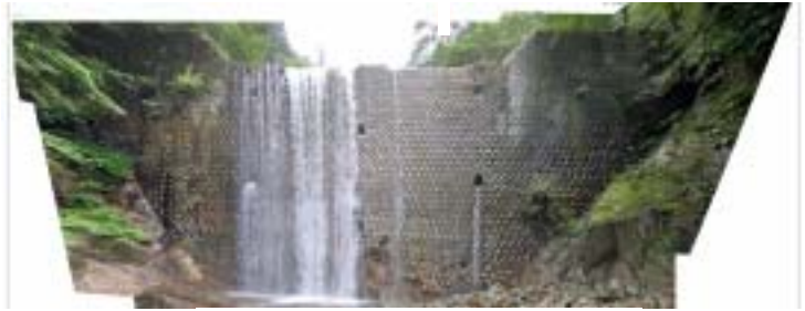
写真-1 正ヶ根第2砂防ダム

検証対象は管内中津川の土石流危険渓流に現存する「正ヶ根第2砂防ダム」である（昭和16年竣工；写真-1）。ダムは堤高14.0m、堤長46m、天端幅2.0m、水通し幅16.0m、上流法勾配4分の施設諸元を有する練石積重力式であり、内部には粗石コンクリートが用いられている。