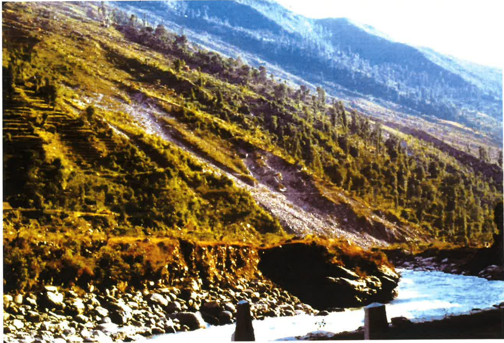
山腹からの土砂供給状況。何回も崩れた様子が分かる。右が下流