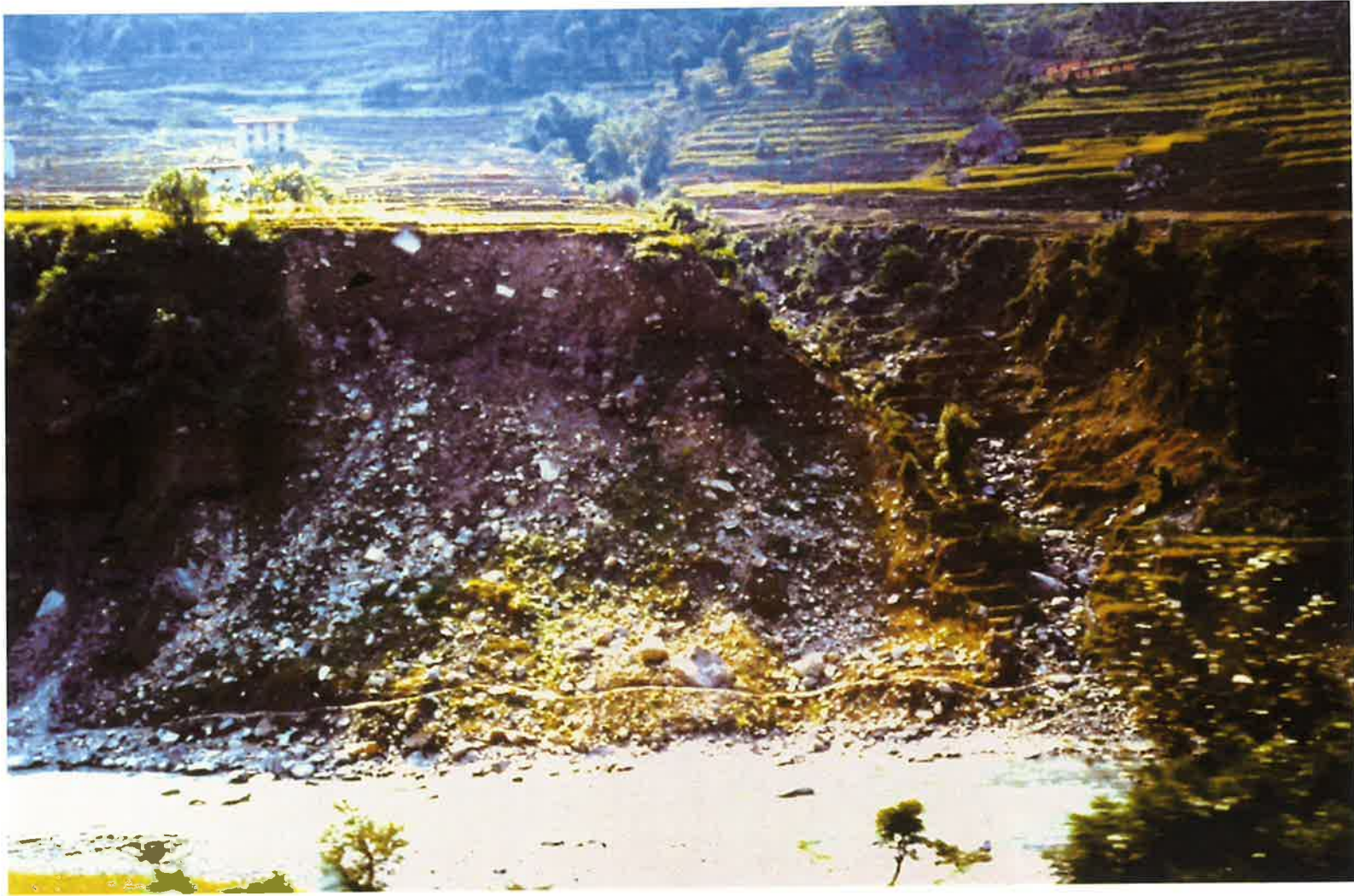
発電所上流部の段丘の河岸崩壊