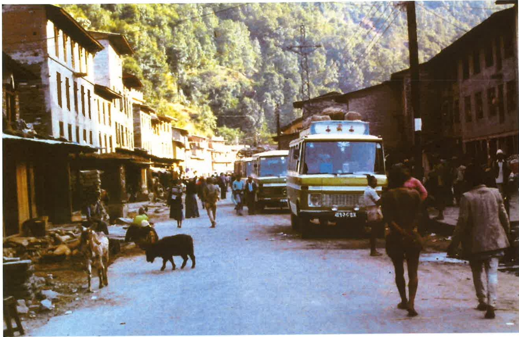
中国との国境の手前にあるBarhabise(バラビセ)村。右側をSunkosi川が流れる。