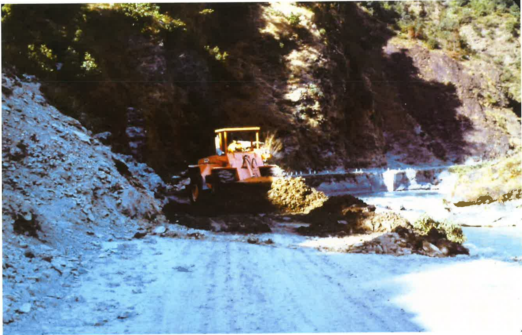
中国との国境へ行く道路沿いの地すべり、土砂は全て河に落とされる