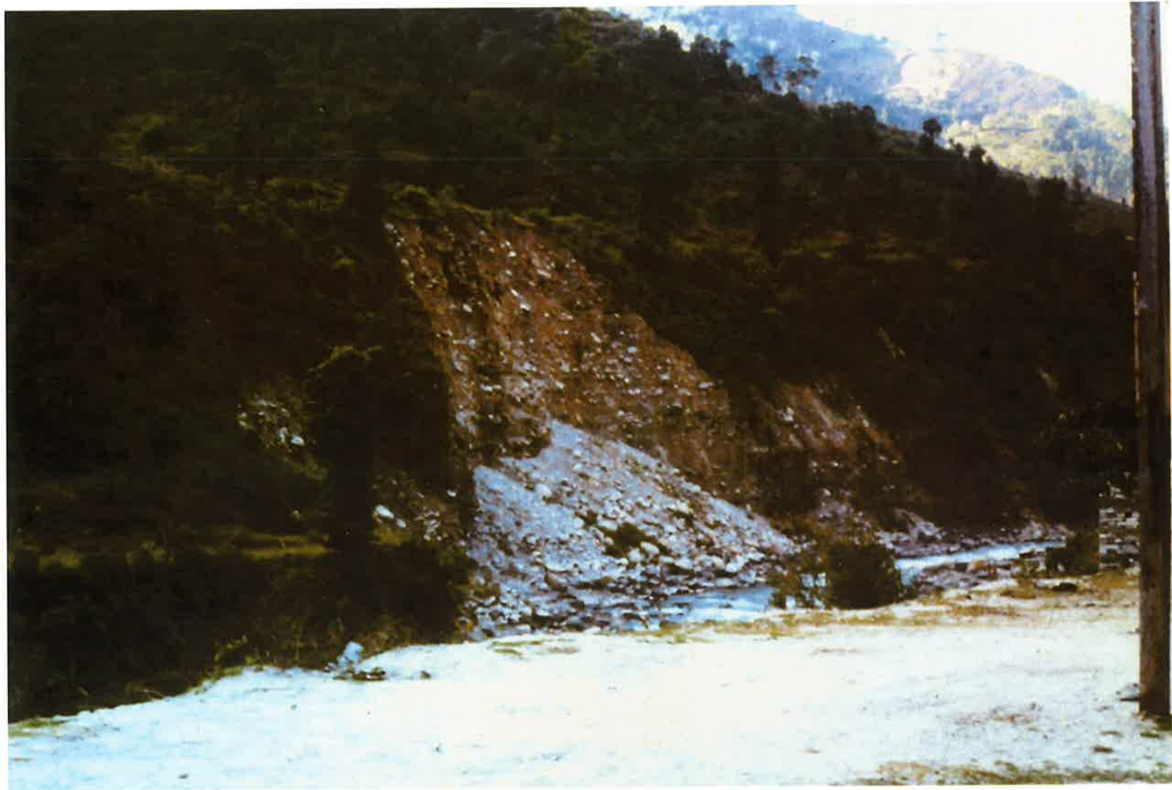
河岸段丘の崩壊状況