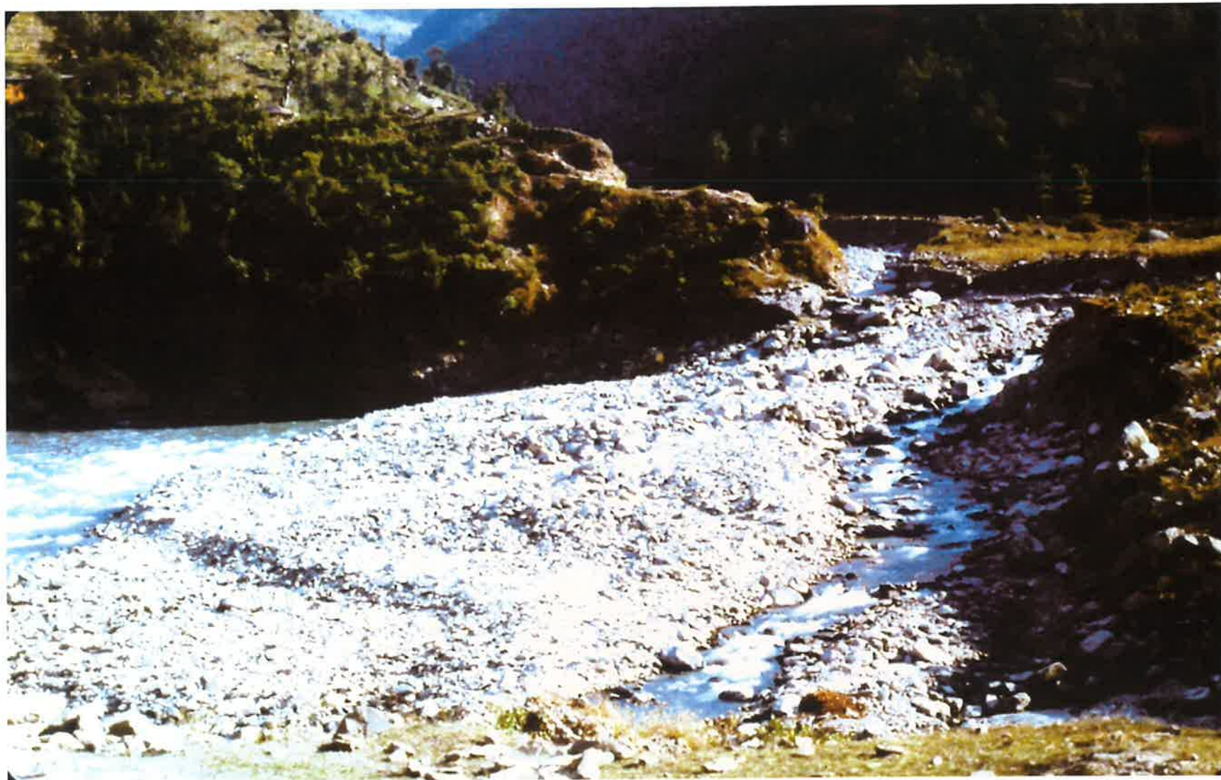
発電所上流部の左支川からの土砂の流出状況