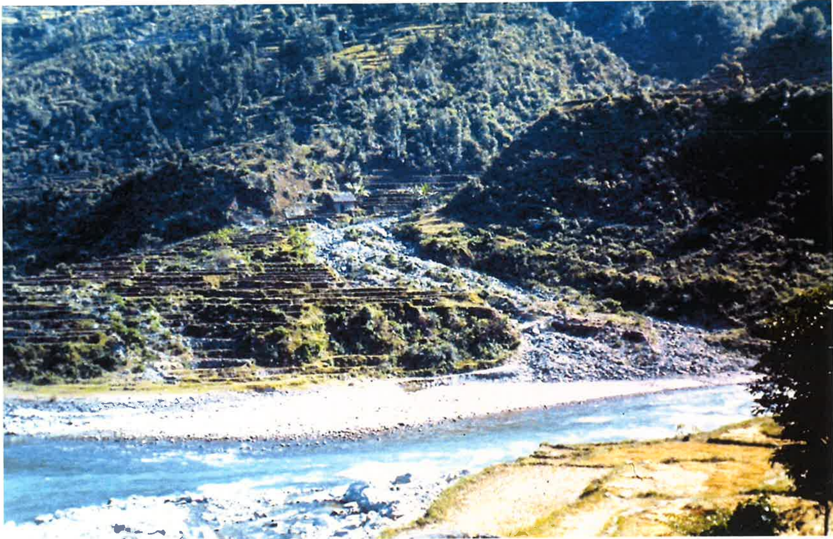
Sunkosi川支川の扇状地と田と土砂流出状況