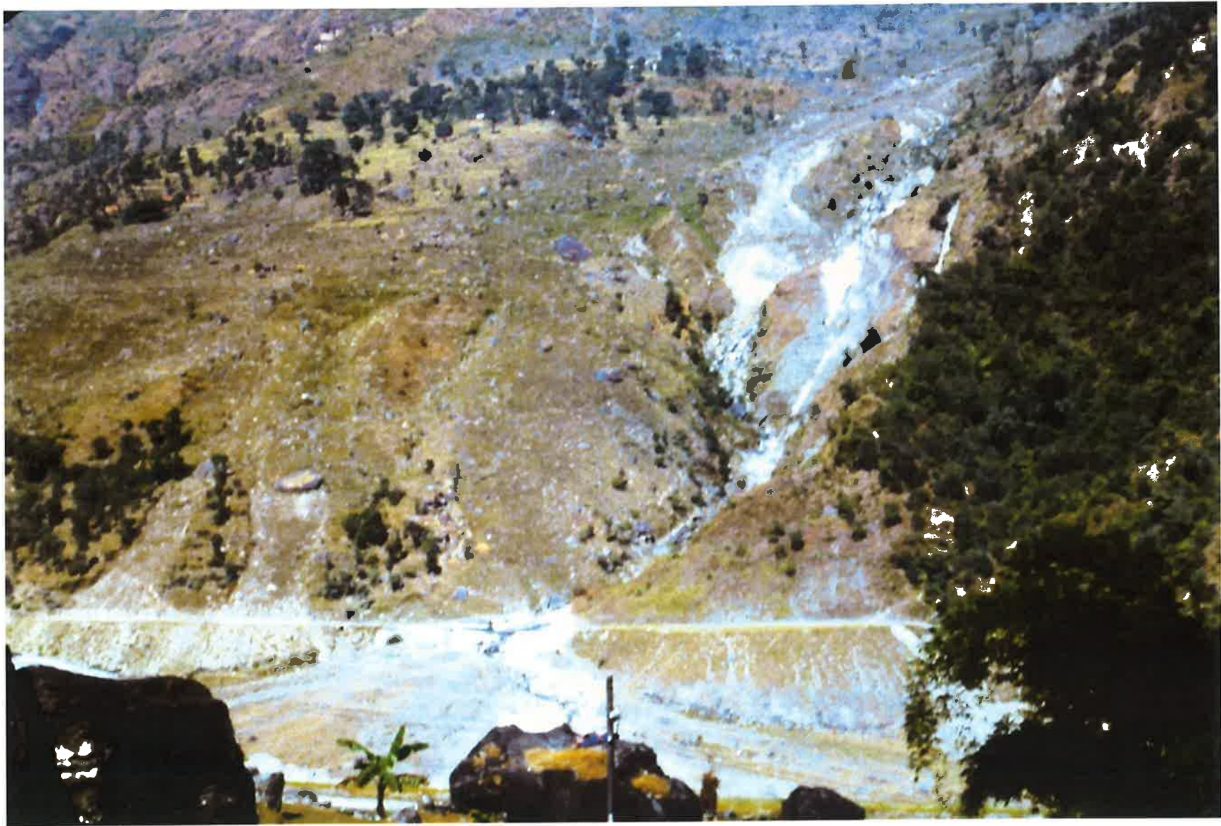
発電所対岸の大規模な崩壊と中国の援助で造った道路