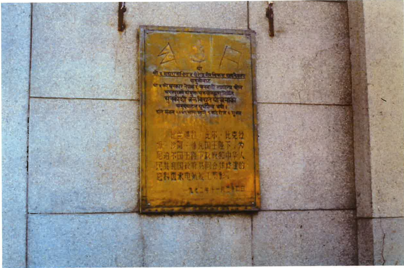
Sunkosi P.S.のプレート。ネパール語と中国語で書かれている