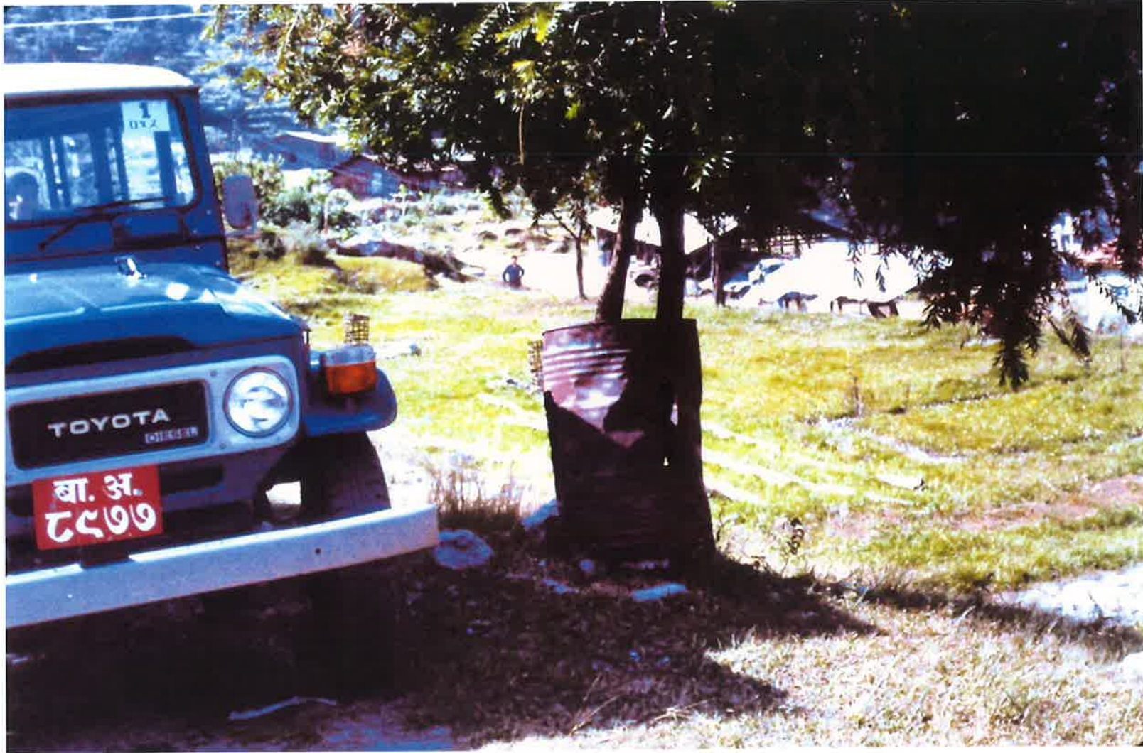
古ドラム缶による樹木の保護、