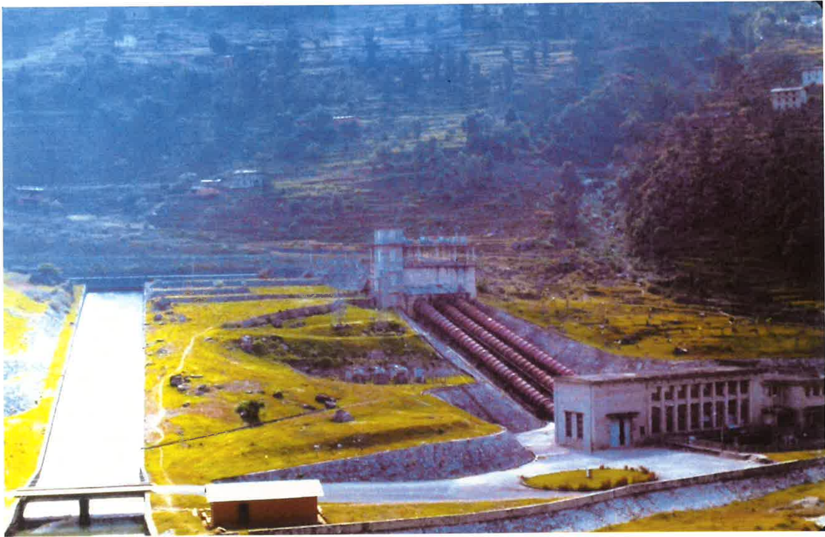
Sunkosi P.S. 中国の援助で1972年に完成した発電所(10,050kw)。道路も中国の援助で造られた。