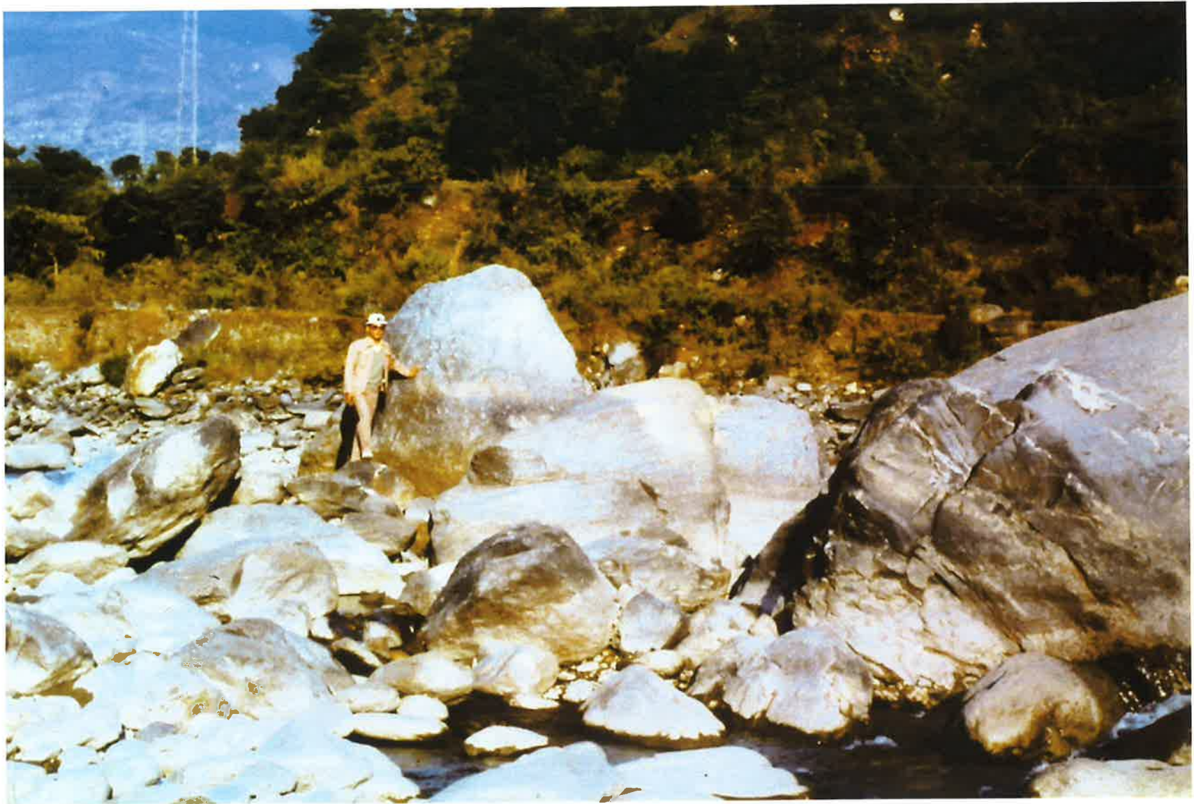
発電所上流にある狭さく部における転石の堆積状況。Max.直径5～6m