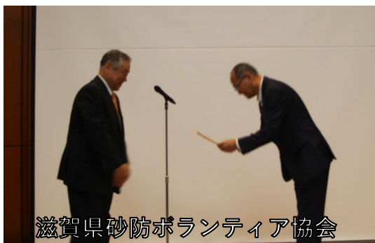
滋賀県砂防ボランティア協会

砂防ボランティア協会の構成員のうち、一定以上の砂防技術を持つ者を所属する砂防ボランティア協会長の推薦に基づき、砂防ボランティア全国連絡協議会会長が斜面判定士に認定し、所属する砂防ボランティア協会で斜面判定士として登録されます。令和8年度は39団体、158名の方が認定されました。