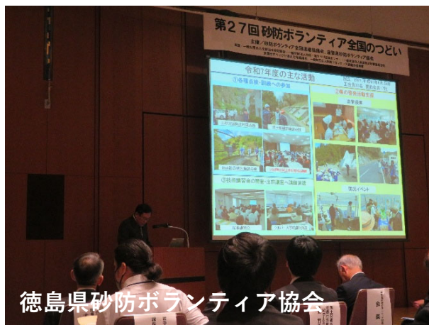
徳島県砂防ボランティア協会