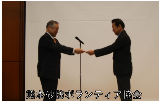
熊本砂防ボランティア協会